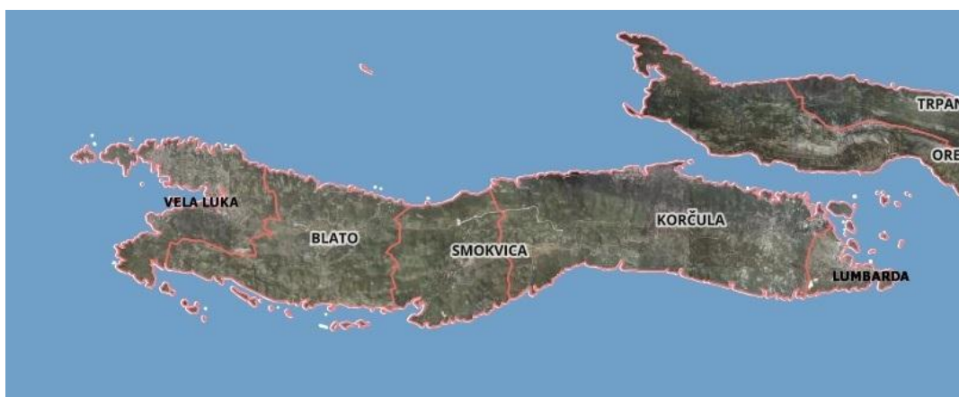
Slika 1. Položaj Grada Korčule

Grad Korčula obuhvaća naselja Pupnat, Račišće, Žrnovo i Čaru te grad Korčulu. Naselja su smještena uz rubove plodnih polja, dok je grad Korčula smješten na poluotočiću u svrhu nadgledanja strateški važnog Pelješkog kanala.