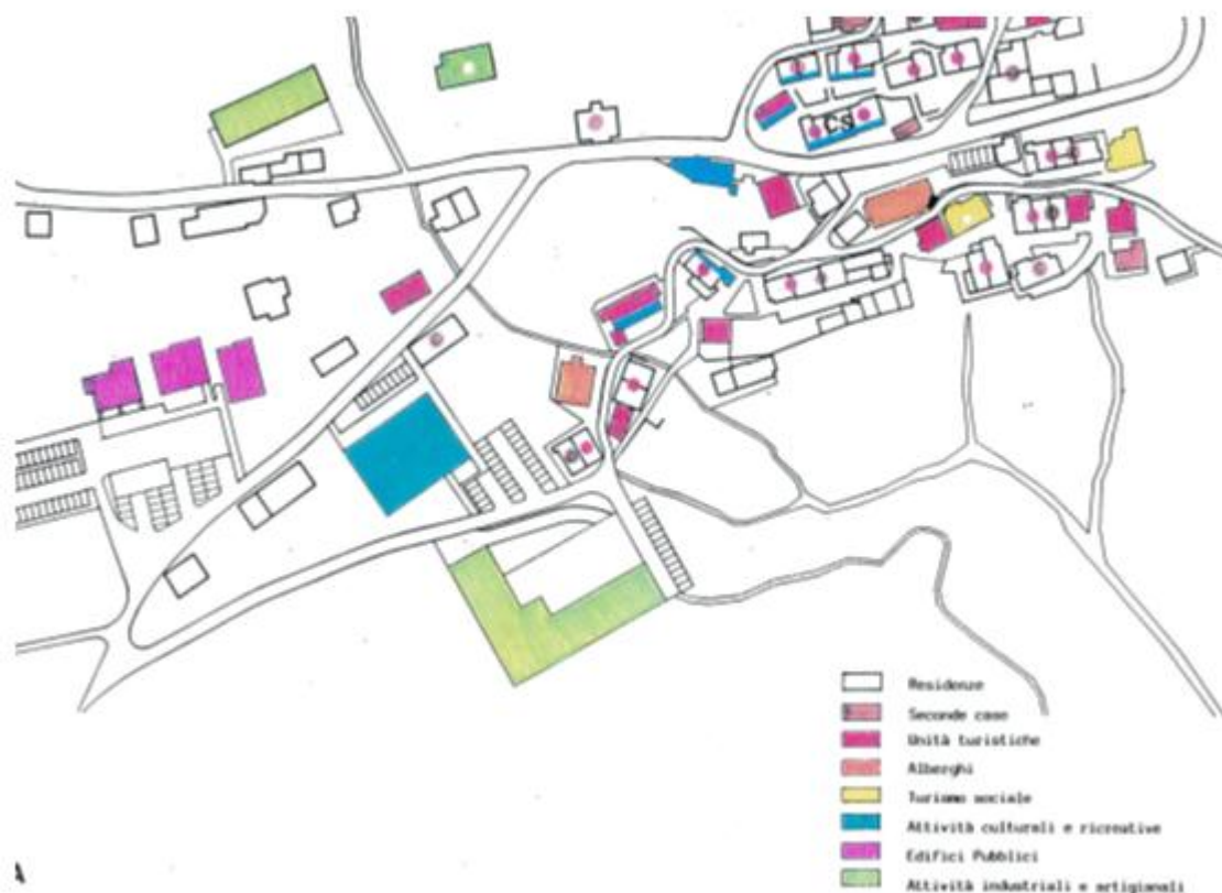
Slika 4. Organizacija koncepta Albergo diffuso

kod posjetitelja o važnosti korištenja usluga lokalnih obrtnika i poduzetnika sa ciljem promicanja lokalne ekonomije. Koncept razvija brojne usluge koje pružaju lokalne kompanije i obrti (razne vrste uslužnih djelatnosti prije svega). Ekološki utjecaj je minimalan jer nema nove gradnje već se bolje iskorištavaju postojeći kapaciteti.