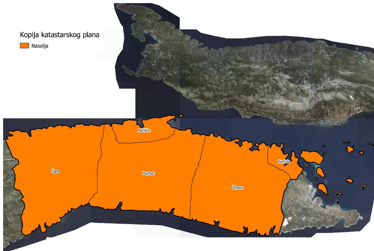
Slika 1: Naselja Grada Korčule, Izvor: Državna geodetska uprava - obrada autora

Grad Korčula prostire se na površini od 112,4169 km 2 i sastoji se od 5 naselja: Čara, Korčula, Pupnat, Račišće i Žrnovo, prikazanih na slici 1.