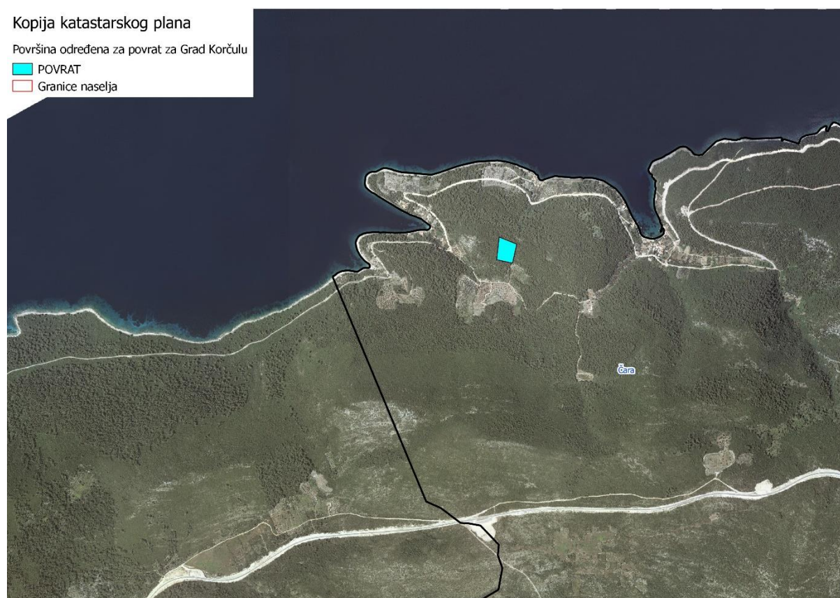
Slika 5: Površine određene za davanje u zakup

Kopija katastarskog plana sa prikazom katastarske čestice poljoprivrednog zemljišta u vlasništvu RH određene za povrat, sa podlogom digitalne ortofoto karte Grada Korčule izrađena je prema službeno dostavljenim podacima Državne geodetske uprave, podataka Ureda državne uprave za potrebe izrade Programa i nalazi se u PRILOGU KKP-3 dok je njen umanjeni prikaz vidljiv na slici 5.