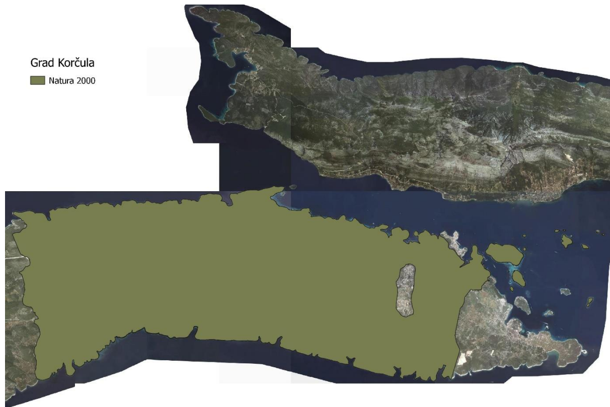
Slika 3: Zaštićena područja (Natura 2000)