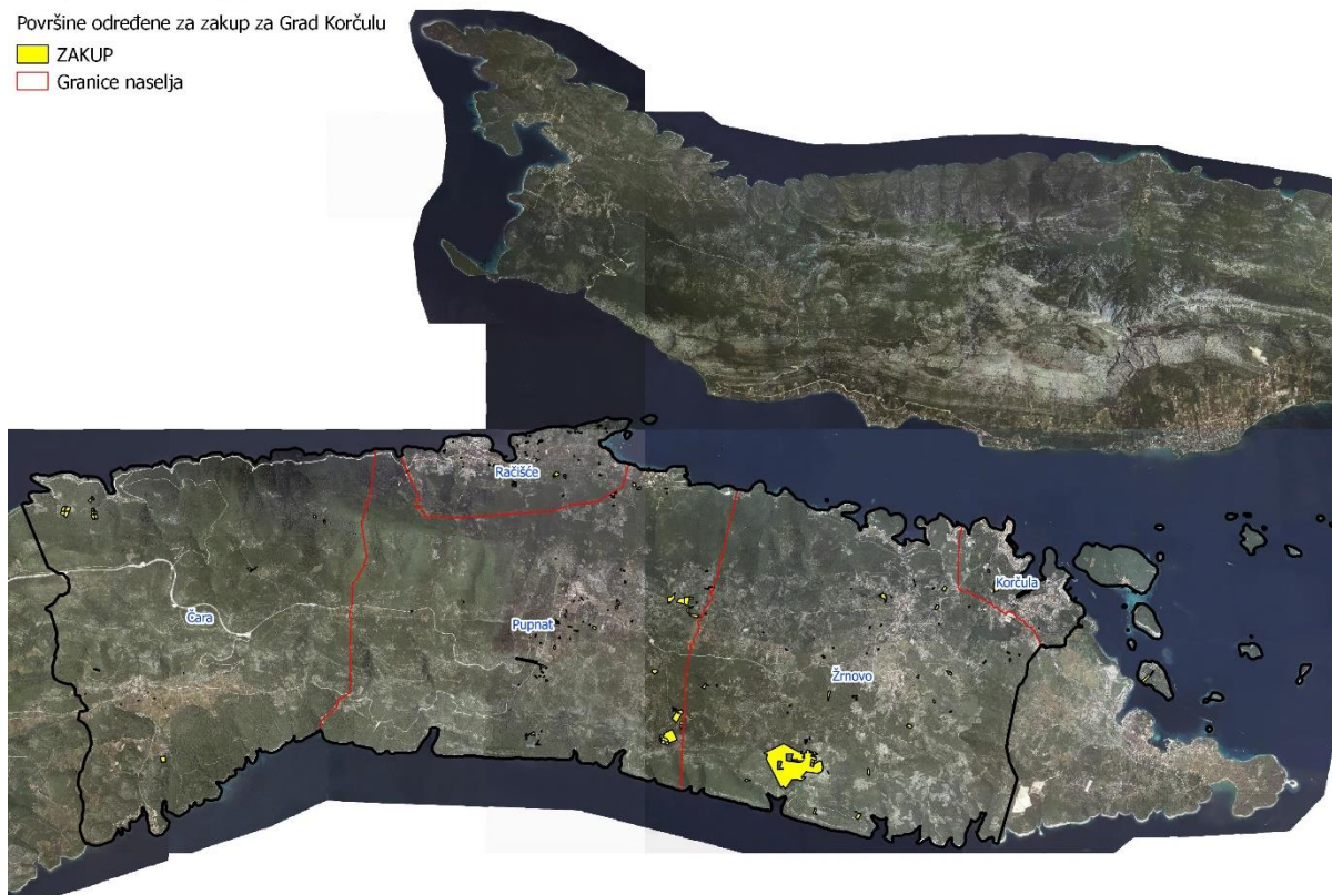
Slika 4: Površine određene za davanje u zakup

Popis svih katastarskih čestica poljoprivrednog zemljišta u vlasništvu RH određenih za davanje u zakup nalazi se u PRILOGU 1.