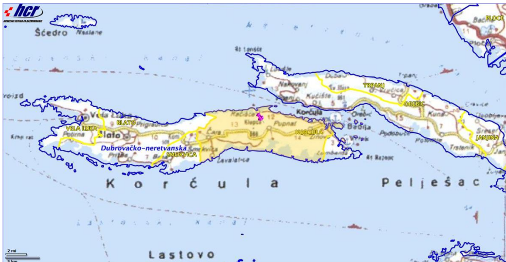
Slika 3. Pregled minski sumnjivih područja, https://misportal.hcr.hr/HCRweb/faces/simple/Map.jspx

Na području Grada Korčule nema minski sumnjivih područja.