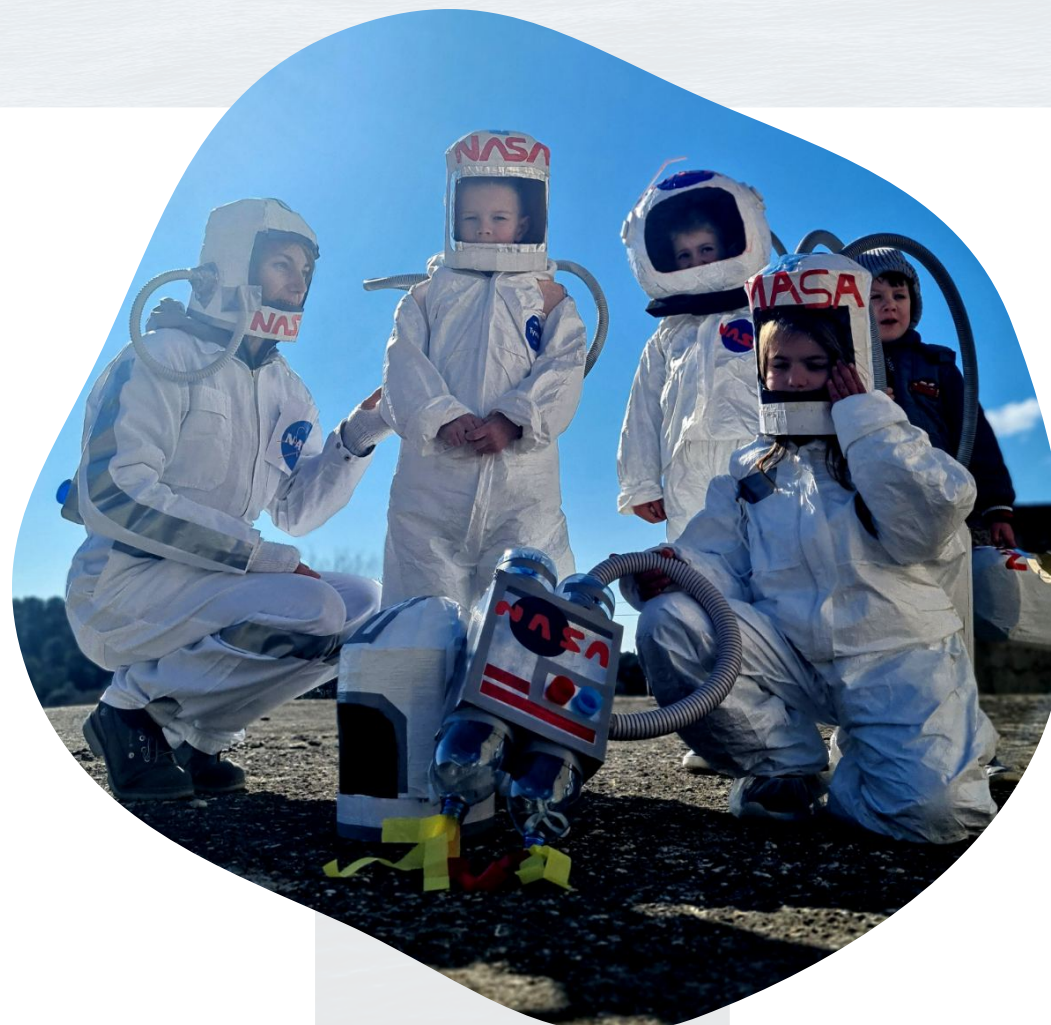
Maškare u DV Pupnat

Ove godine imamo veći broj djece s teškoćama s vještačenjem ali i one djece koja nemaju vještačenje, a odstupaju u razvoju od svojih vršnjaka.