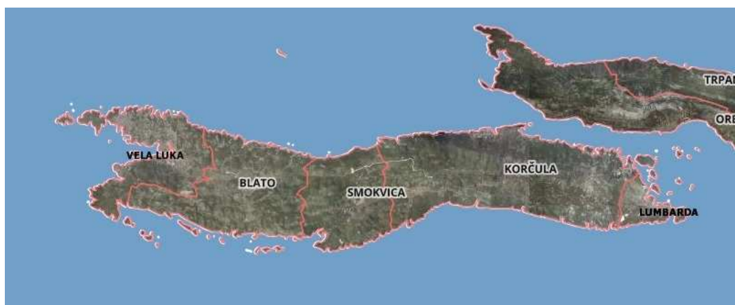
Slika 1. Položaj Grada Korčule

Grad Korčula obuhvaća naselja Pupnat, Račišće, Žrnovo i Čaru te grad Korčulu. Naselja su smještena uz rubove plodnih polja, dok je grad Korčula smješten na poluotočiću u svrhu nadgledanja strateški važnog Pelješkog kanala.