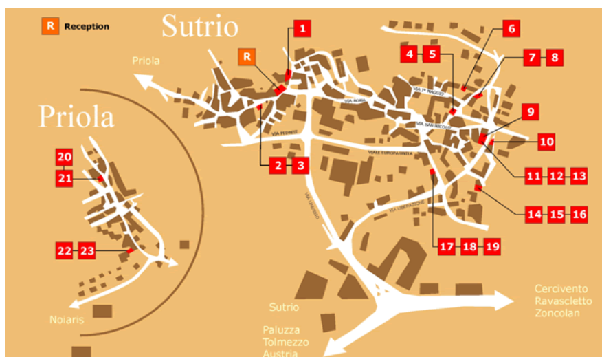
Slika 3. Ideja i cilj koncepta Albergodiffuso

Danas u Italiji ima preko 40 Raspršenih hotela koji su organizirani kroz nacionalnu zajednicu te koji su podupirani od strane talijanskih regija sa zakonskom regulativom koja potiče takvu vrstu organizacije. Hrvatska je jedna od prvih zemalja koja je prihvatili takav koncept te ga nastoji poticati i kroz zakonsku regulativu.