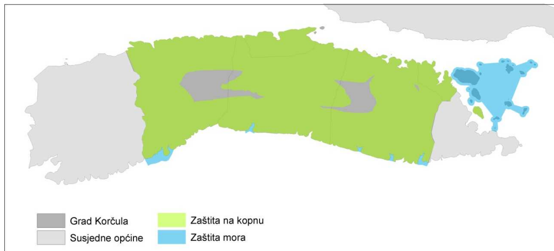
Slika 2. Zaštićeno područje Grada Korčule

Digitalna analiza pokazuje da, s obzirom na gore navedeno, ukupna površina zaštićenih dijelova, bilo prirodnih ili kulturnih, iznosi 12.043,4ha od čega na kopneni dio otpada 10.307,6ha, odnosno 91,78% kopnene površine Grada Korčule (11.231 ha).